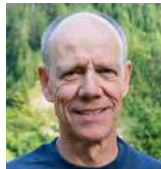
Hermann Albrecht Bergbau / Produktion